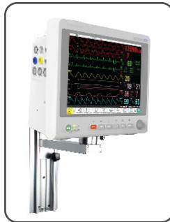
Soporte de pared