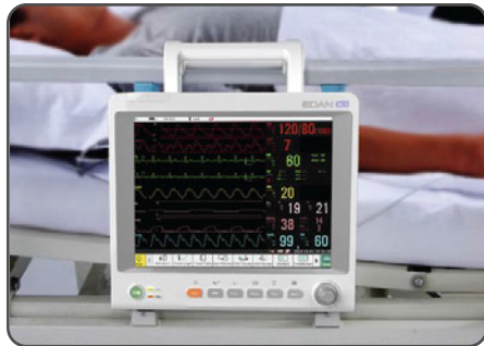
Gancho para riel de cama